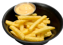
FRANSKAR með kokteilsósu