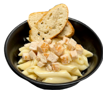
PASTA Í RJÓMASÓSU með kjúklingi og brauði