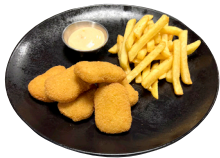
KJÚKLINGANAGGAR franskar og kokteilsósa til hliðar - 6 stk