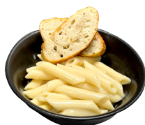
PASTA Í RJÓMASÓSU með brauði