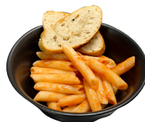
PASTA Í TÓMATSÓSU með brauði