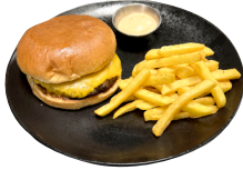
HAMBORGARI Ostur, franskar og kokteilsósa til hliðar