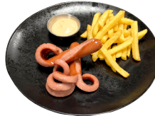
KRABBAPYLSUR Franskar og kokteilsósa til hliðar