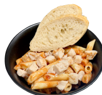
PASTA Í TÓMATSÓSU með kjúklingi og brauði