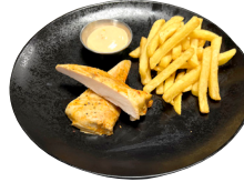
KJÚKLINGABRINGA Franskar og kokteilsó- sa til hliðar