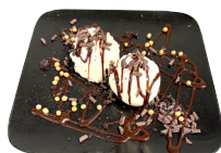
TVÆR ÍSKÚLUR með súkkulaðisósu