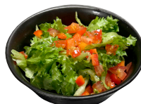
FERSKT SALAT Tómatar og paprika