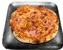
PIZZA 7" með einu álegg