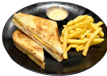
SAMLOKA Skinka, ostur, franskar og kokteilsósa til hliðar