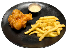
DJÚPSTEIKTUR FISKUR Franskar og kokteilsósa til hliðar